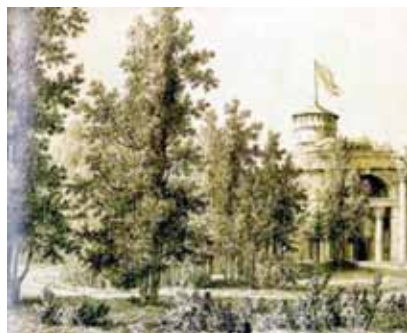
Руина в парке дачи Кушелева-Безбородко

В середине XVIII века на этом месте находился древесный питомник, пожалованный в 1773 году сенатору Г.Н. Теплову. В 1773–1777 годах для него архитектором Василием Баженовым был построен усадебный дом в готическом стиле. Предполагается, что Ба-