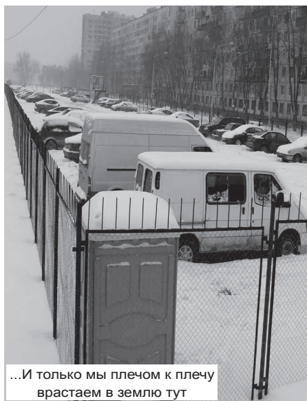
...И только мы плечом к плечу взрастаем в землю тут

это или близко? Много это или мало – 26 метров от выхлопной трубы автомобиля до открытой форточки? С точки зрения жильцов – недопустимо мало, а на взгляд