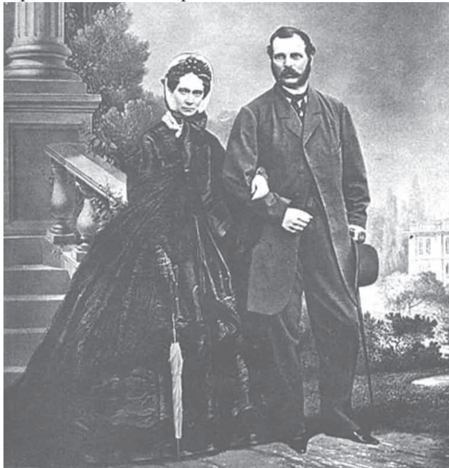
Император Александр II и императрица Мария Александровна

думы занимаются делами своего округа и выбирают уездное правление и депутатов губернской думы. Последняя и должна избирать из своих членов депутатов для высшего представительного органа - Государственной Думы. Таким образом, она формировалась бы в результате «трехстепенных» выборов.