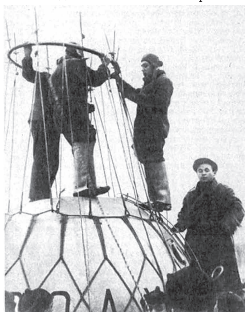
Экипаж перед полётом

знать, что в четыре часа дня истерзанный, обреченный «Осоавиахим -1» пронёсся над их головами, и что именно в этот момент гондола окончательно оторвалась