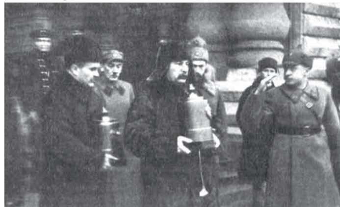
Сталин и Молотов несут урны с прахом стратонавтов