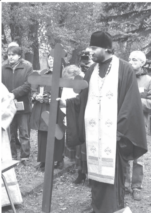
Закладной крест будущего храма

Просьбу удовлетворили, и в октябре 1941г. епископ Лука назначен консультантом всех госпиталей Красноярского края и главным хирургом эвакогоспиталя. Самые тяжелые операции, осложненные обширными нагноениями, приходится делать прославленному хирургу. При инспекторской проверке было отмечено, что ни в одном из госпиталей не видели таких блестящих результатов лечения инфекционных ранений суставов. В 1946 году Лука, к тому времени уже архиепископ Тамбовский и Мичуринский, становится лауреатом Сталинской премии первой степени за научную разработку новых хирургических методов лечения гнойных заболеваний и ранений.