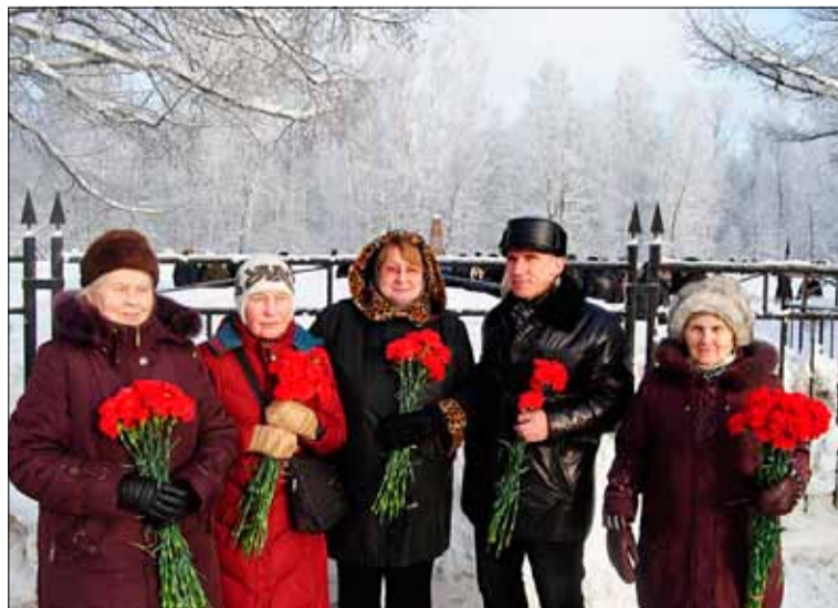
Работники «Арсенала» перед церемонией возложения цветов

В концертной программе праздника приняли участие артисты вокально-эстрадного ансамбля «Ка-