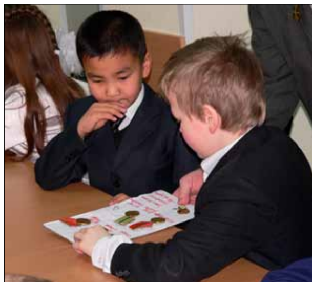
«Ух ты, настоящие медали!»