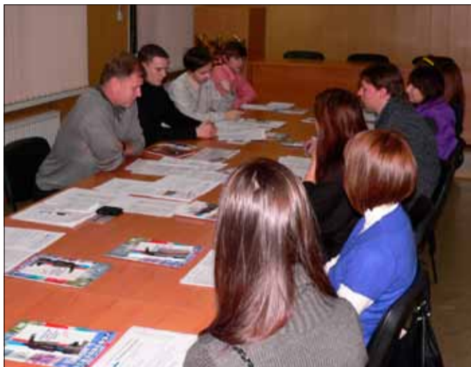
На заседании Молодежного совета

В конце заседания все члены совета получили красочный альбом «Итоги 2010 года. Военно-патриотическая работа