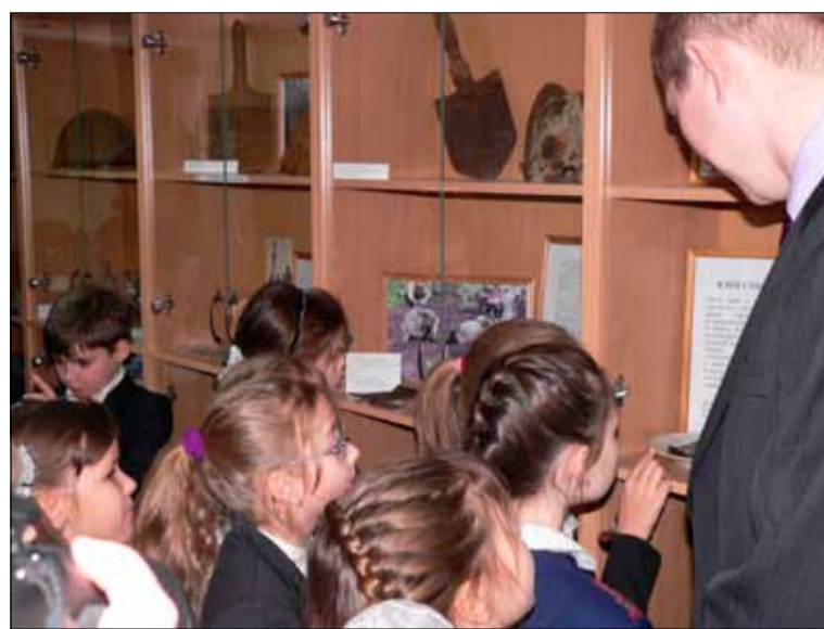
На выставке экспонатов, переданных МО Финляндский округ

Книга Памяти «Никто не забыт, ничто не забыто». Часть 1.