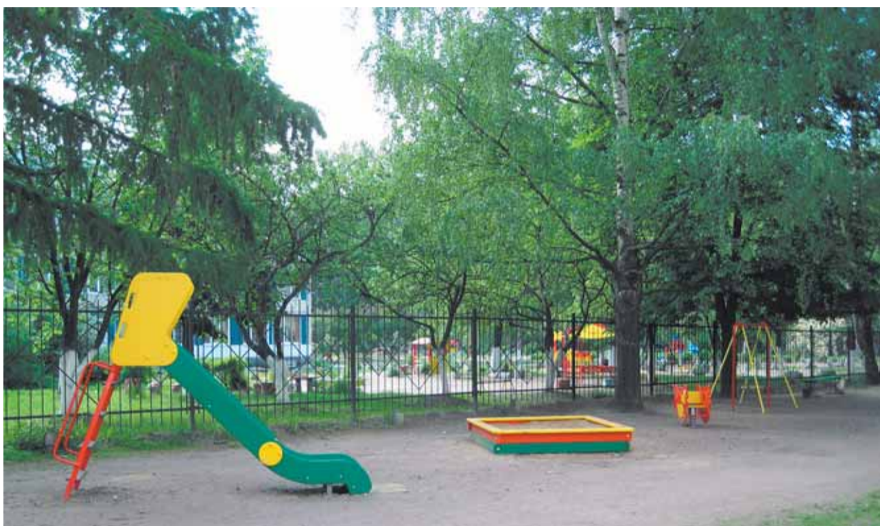
ул. Замшина, д. 27/1