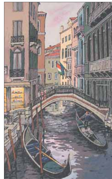
«Венеция», из серии «Европейские каникулы»