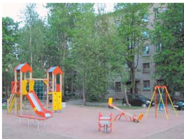
ул. Федосеенко, д. 36

Для кого-то весна и лето – время долгожданного отпуска и отдыха, а для сотрудников отдела благоустройства Местной администрации муниципального образования Финляндский округ – это самая горячая пора. Ведь именно в этот период каждый год наиболее активно ведутся работы по благоустройству территорий. И жители наверняка заметили, как похорошели за последнее время дворы нашего округа: появились новые яркие детские площадки, дополнительные парковочные места для машин, установлены искусственные неровности, позволяющие регулировать скорость автомобилей во дворах. По некоторым адресам проведено уширение внутриквартальных проездов, высажено немало кустарников. Все работы ведутся согласно Целевой муниципальной программе и выполняются для того, чтобы дворы нашего округа стали более комфортными.