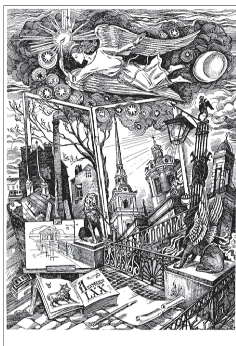
«Душа города», из серии «Неповторимый Петербург»