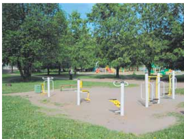
ул. Замшина, д. 31 – Бестужевская ул., д. 31