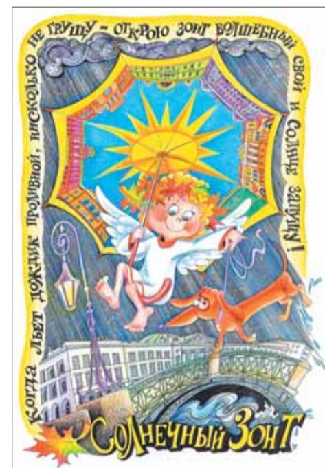
«Солнечный зонт», из серии «Питерские ангелята»

тем поступила на художественно-графический факультет в Институт им. Герцена. По окончании три года проработала в школе, уволилась и устроилась в Издательский дом «Женское счастье» ведущим художником. Также была методистом в учебно-методическом центре профсоюзов. Помимо этого оформляла буклеты и открытки для различных издательств и организаций. Работала в Клубе юных моряков, оформителем в детских садах и школах города. С 2005 года тружусь в издательстве «Литера», создаю иллюстрации к детским книжкам – наконец-то нашла то, чем так давно хотела заниматься!