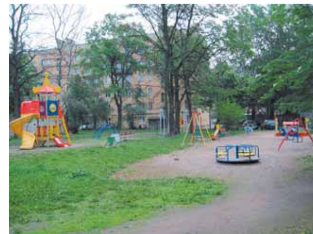
Кондратьевский пр., д. 51/1