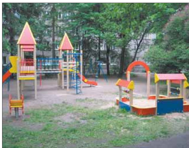
Кондратьевский пр., д. 52