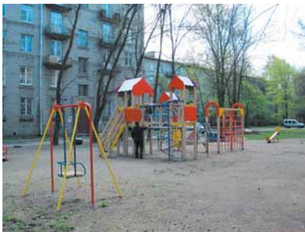
Кондратьевский пр., д. 61–63