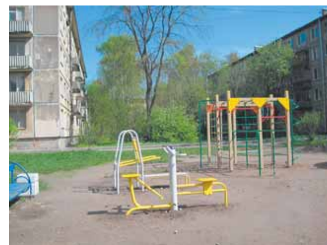
ул. Федосеенко, д. 31