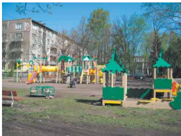
ул. Федосеенко, д. 31