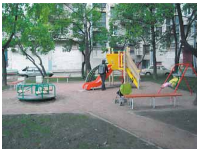
Кондратьевский пр., д. 33