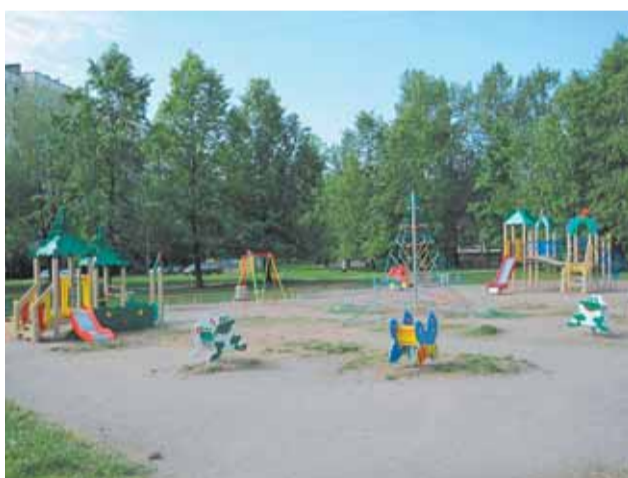
ул. Замшина, д. 31 – ул. Бестужевская, д. 31