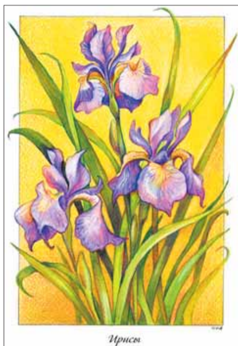
«Ирисы», из серии «У меня в садочке»