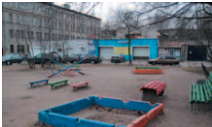
пр. Металлистов, д. 94