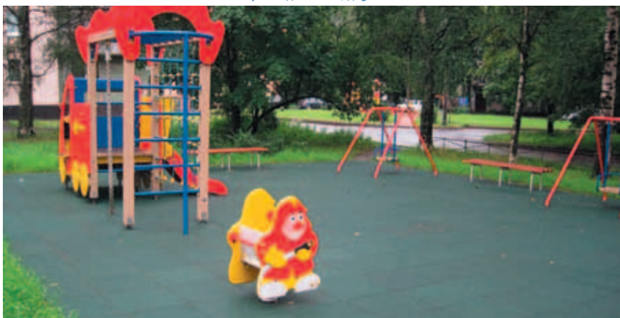
пр. Маршала Блюхера, д. 21-3