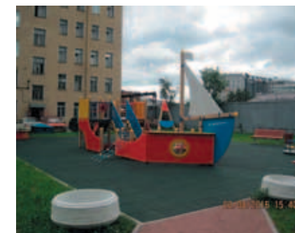
Кондратьевский пр., д. 17