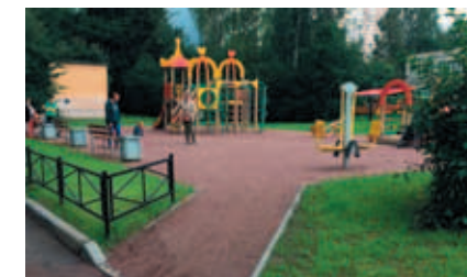
ул. Замшина, д. 50