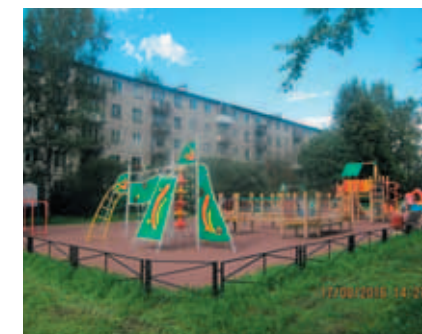
пр. Металлистов, д. 63