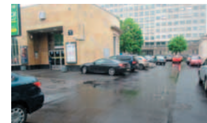
ул. Боткинская, д. 1