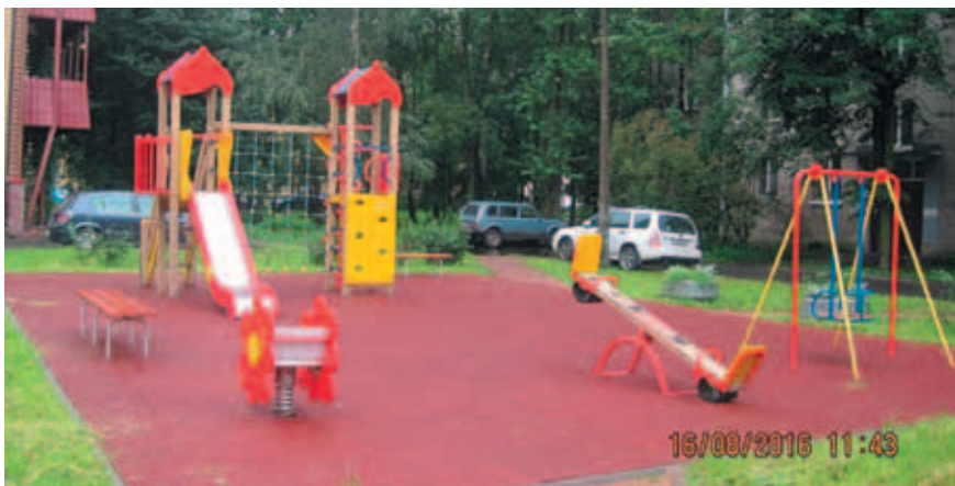
ул. Федосеенко, д. 36