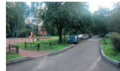
Пискаревский пр., д. 20 – пр. Металлистов, д. 59, 61