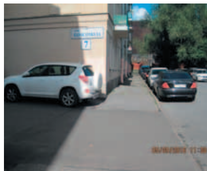
ул. Комсомола, д. 5–7