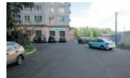
Пискаревский пр., д. 20 – пр. Металлистов, д. 59, 61