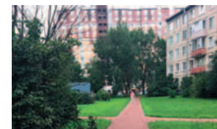
ул. Замшина, д. 18–20