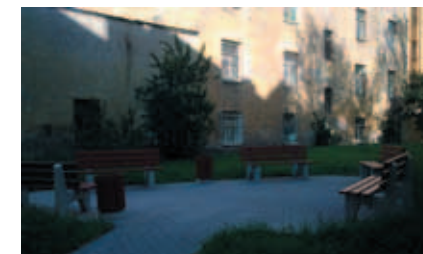
Лесной пр., д. 3А