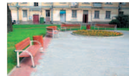
Бестужевская ул., д. 27