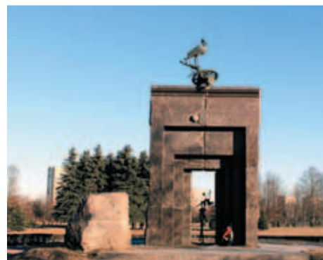
Памятник жертвам радиационных аварий и катастроф в Парке академика Сахарова