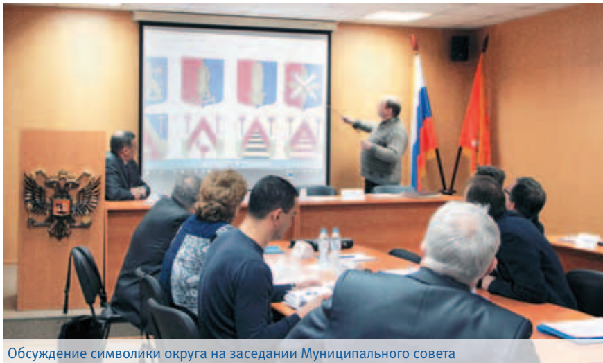
Обсуждение символики округа на заседании Муниципального совета

21 марта 2017 года на заседании Муниципального совета депутаты утвердили официальную символику Финляндского округа.