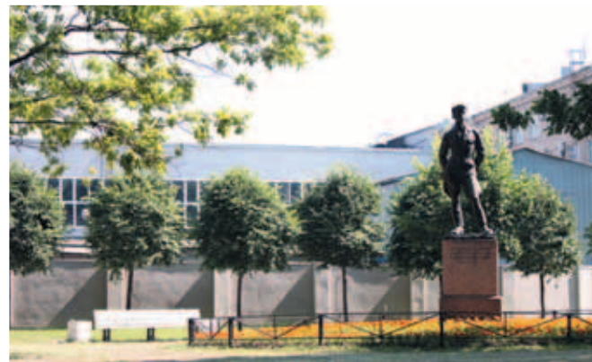
Памятник Саше Кондратьеву в сквере на Свердловской набережной