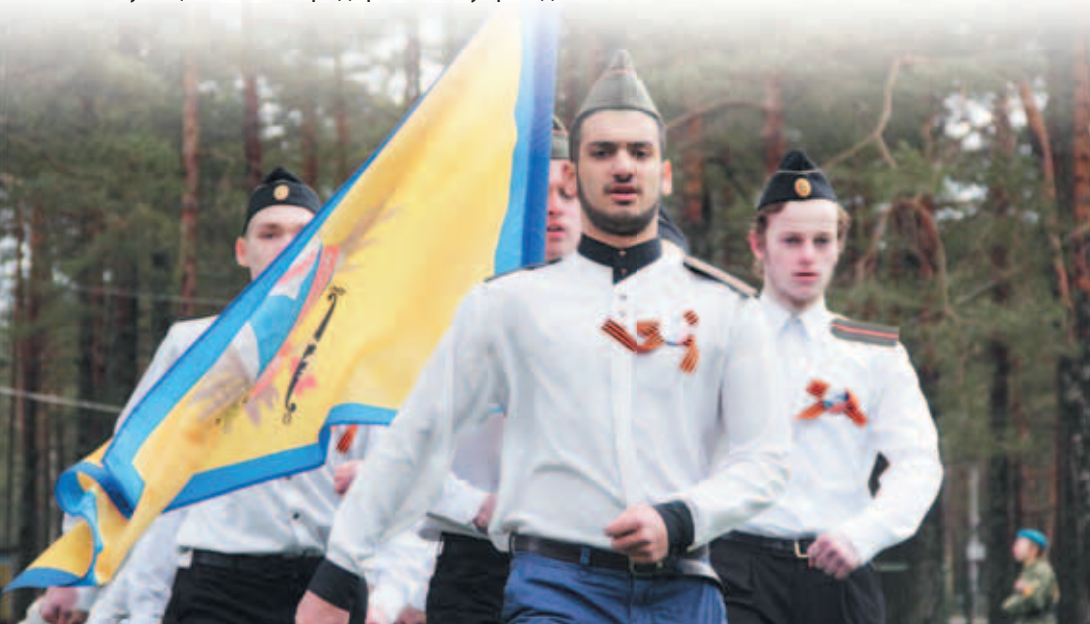
Команда школы №139. Военно-патриотический сбор

27) создание муниципальных предприятий и учреждений, осуществление финансового обеспечения деятельности муниципальных казенных