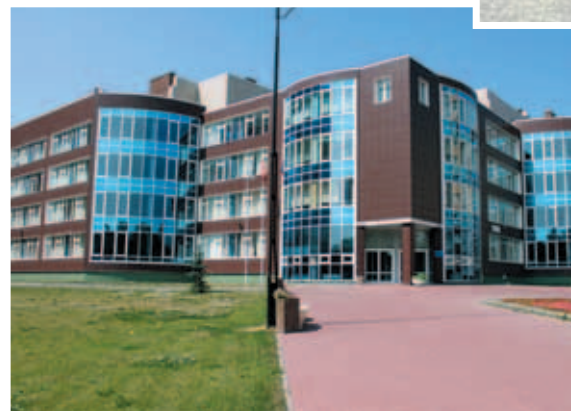
Лицей №126, ул. Замшина, д. 14