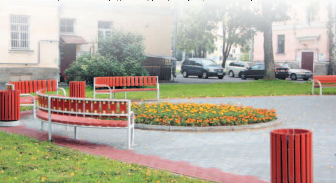
Зона отдыха на ул. Бестужевской, д. 27

42) оказание в порядке и формах, установленных законом Санкт-Петербурга, поддержки гражданам и их объединениям, участвующим в охране общественного порядка на территории муниципального образования.