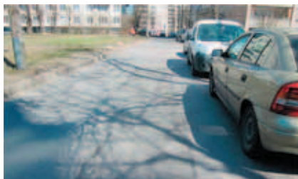
Бестужевская ул., д. 33, корп. 3