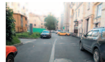
ул. Комсомола, д. 16 – пл. Ленина, д. 3