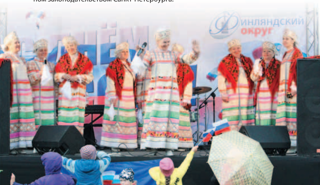
День России. Концерт в Любашинском парке

участие в пределах своей компетенции в обеспечении чистоты и порядка на территории муниципального образования, включая ликвидацию несанкционированных свалок бытовых отходов, мусора и уборку территорий, водных акваторий, тупикиков и проездов, не включенных в адресные программы, утвержденные исполнительными органами государственной власти Санкт-Петербурга;