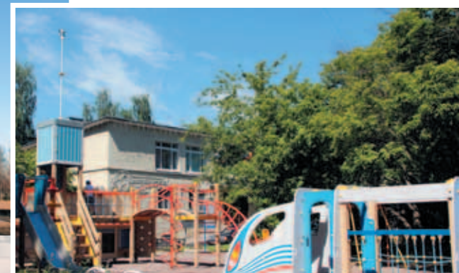
Новая детская площадка «Финляндский вокзал», пр. Металлистов, д. 89