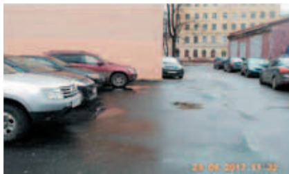
Михайлова ул., д. 9–11