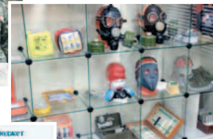
Уголок ГО ЧС активного типа