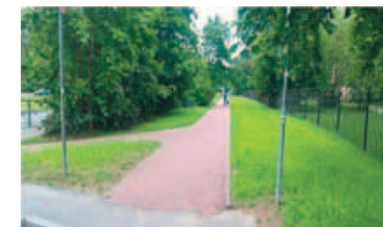
ул. Замшина, д. 15–19