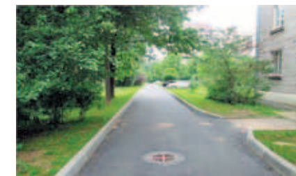
Герасимовская ул., д. 12