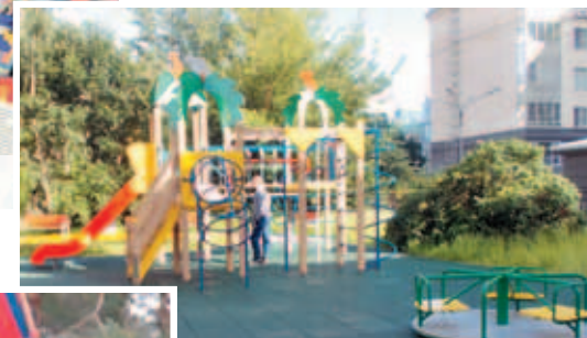
Новая детская площадка на ул. Комсомола, д. 16 – пл. Ленина, д. 3