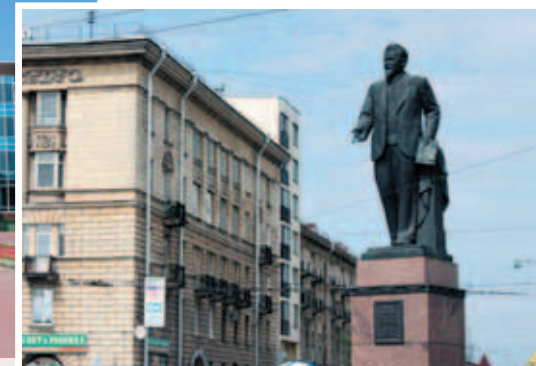
Памятник М. И. Калинину на Площади Калинина