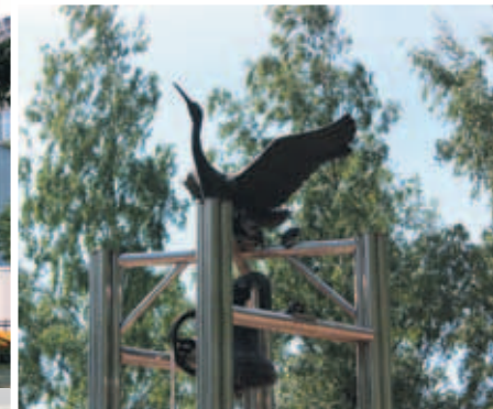
Памятник «Колокол мира» в Парке академика Сахарова