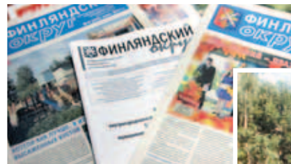
Выпуски газеты «Финляндский округ»