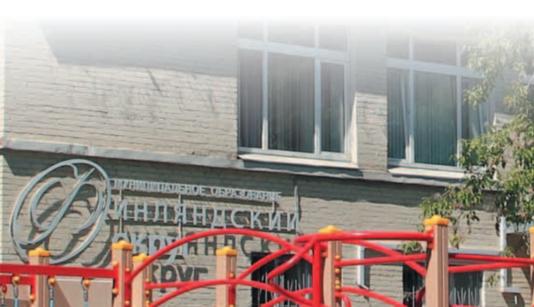
Здание Муниципального совета Финляндского округа. Вид со стороны детской площадки

Органы местного самоуправления располагаются по адресу: пр. Металлистов, д.93 лит. «А».