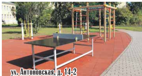
ул. Антоновская, д. 14-2

2 Демонтаж травмоопасного игрового оборудования