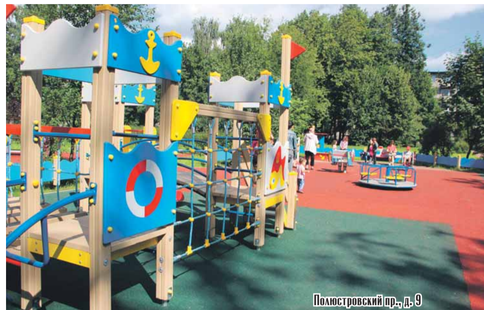
Полюстровский пр., д. 9