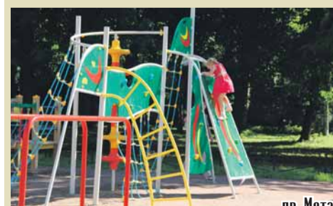
пр. Металлистов, д. 63