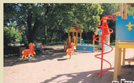
пр. Металлистов, д. 94