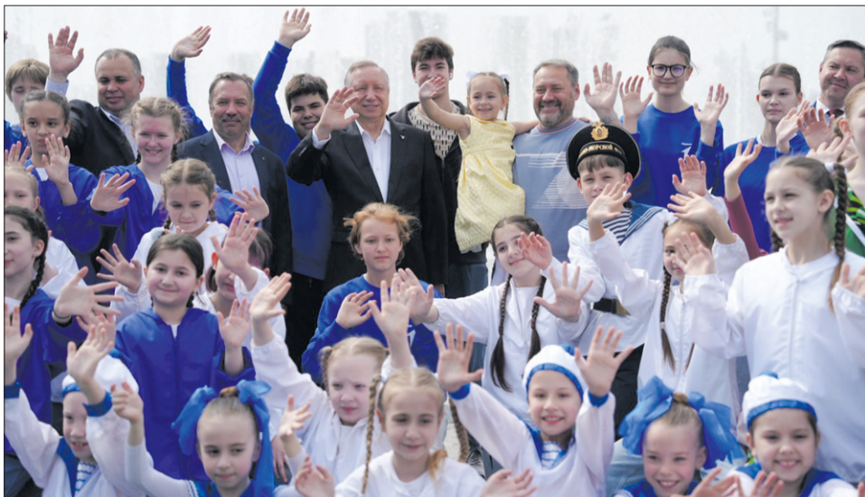
Санкт-Петербург, 29 мая 2025 года. Александр Беглов и Александр Бельский запустили новый светомузыкальный фонтан в Линейном парке на Васильевском острове

ные фонтанные комплексы на Московской площади и площади Ленина, светомузыкальный фонтан в Петергофе на Торговой площади, фонтан «Крестики-нолики» в Сестрорецке и фонтан у Гостиного двора в Кронштадте, а 1 июня запустят после реконструкции фонтан на Госпитальной улице в Павловске. В общей сложности в этом се-